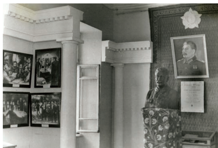
Выставка, посвященная 70-летию со дня рождения И.В. Сталина.