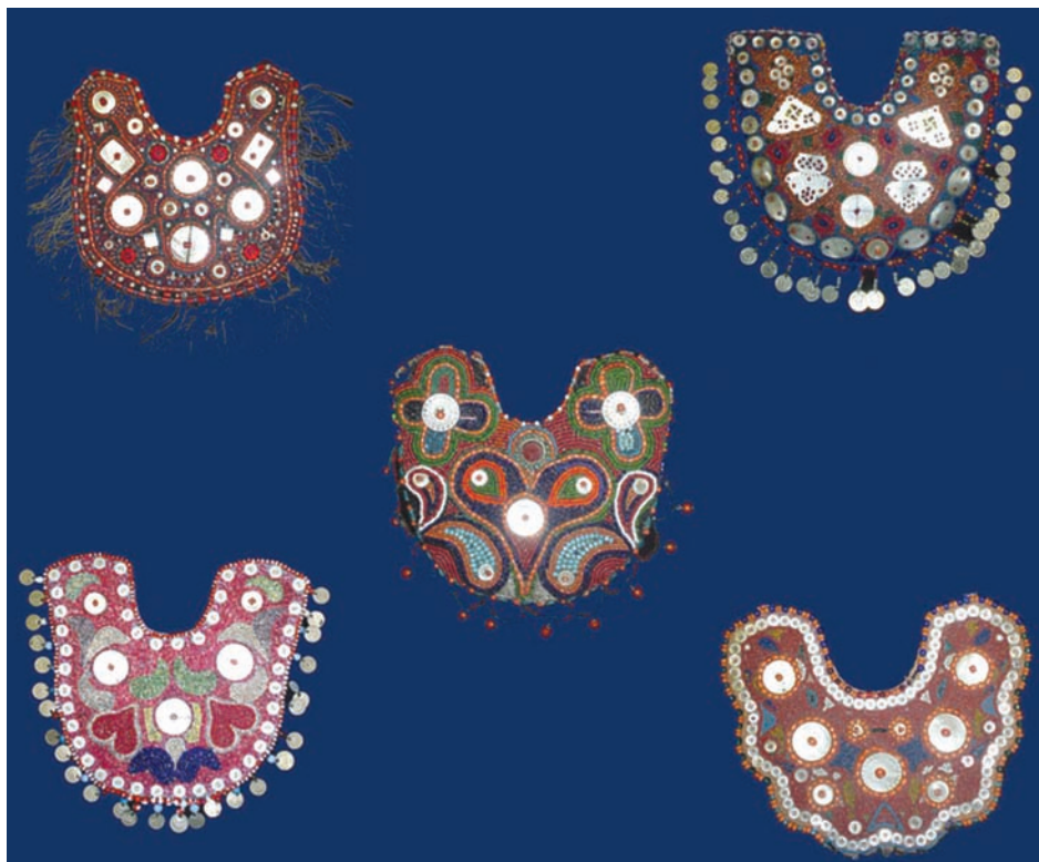
Пого – традиционное хакасское женское нагрудное украшение

Выставка будет работать в здании Дворца Олега Рязанского кремля до 20 октября.