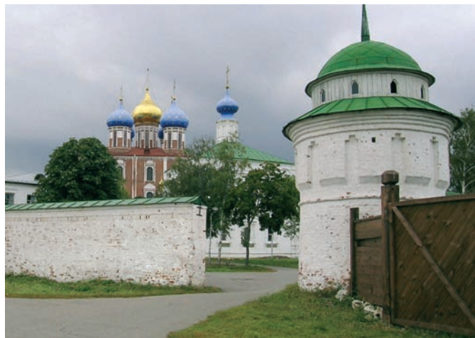
Восстановленная юго-западная башня

Западная часть монастырской стены обращена к крепостному валу. В