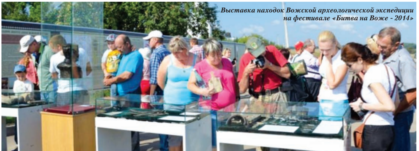
Выставка находок Вожской археологической экспедиции на фестивале «Битва на Воже - 2014»

В середине XIV в. городище пустеет, люди возвращаются только в XVI в. При создании засечной черты здесь размещают один из узловых пунктов Вожской засеки. В слое XVI–XVII вв. мы нашли около 10 монет, множество наконечников стрел, ножи, фрагменты посуды, остатки хозяйственных построек. Тогда тоже боролись с эрозией почвы: один из овражков был засыпан навозом из конюшни, в котором было много подковочных гвоздей и подков... Где войско, там и конница.