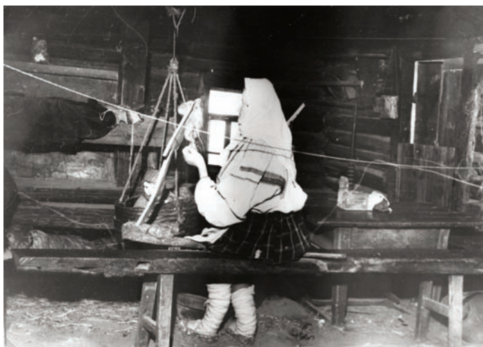
Интерьер «Курная изба из с. Федоровского Захаровского района» в экспозиции Рязанского областного краеведческого музея