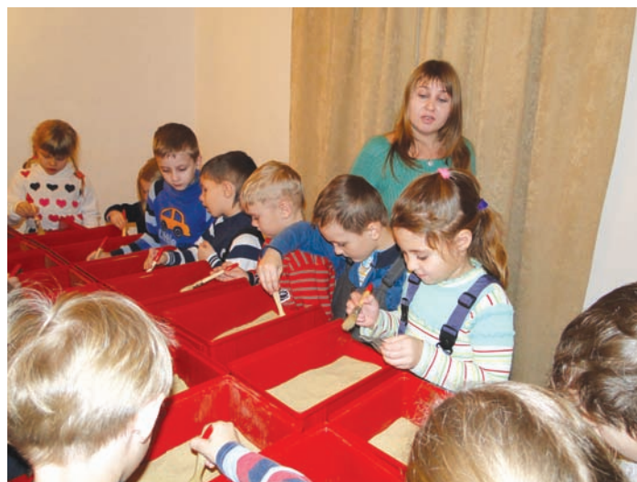
Занятие по археологии

Каждое последующее занятие состоит из трех частей. Педагог в детском саду предварительно знакомит с темой,