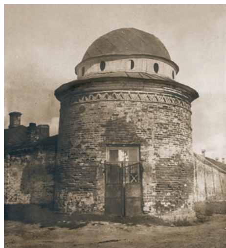
Северо-западная башня до реставрации. 1945 г.

В настоящее время оградой с восточной стороны монастыря служат