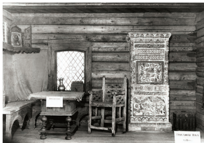
Интерьер «Приказная изба в Переяславле Рязанском, XVII век»