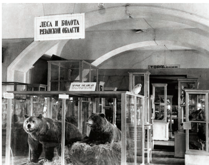
Экспозиция «Животный мир Мещеры»