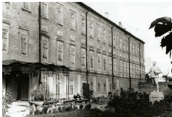
Передний фасад здания Рязанского областного краеведческого музея (Дворец Олега)