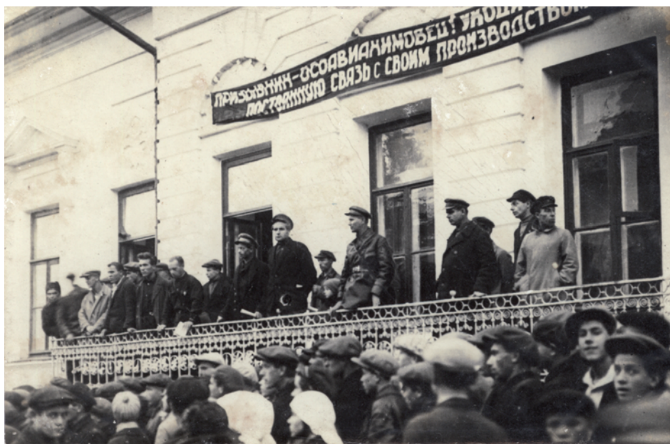
1931 г. Митинг по случаю отправки призывников в ряды РККА. В 1930-е гг. белокаменный балкон на главном фасаде здания был полностью разобран

ние населения противохимической и противовоздушной обороне, радиоделу. В Доме Оборона действовал Рязанский областной совет Общества содействия обороне, авиационному и химическому строительству и штаб Гражданской обороны. Здесь же готовили инструкторов кружков военных занятий и стрелкового спорта, пропагандистов и агитаторов, проходили занятия радиокурсов и курсы подготовки авиационных команд.