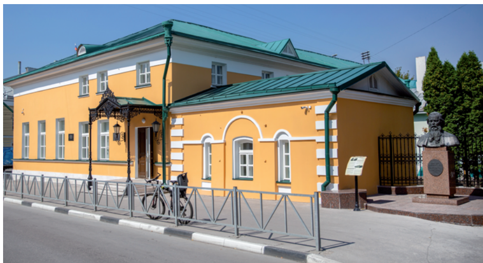
В настоящее время в здании размещается отдел нашего музея – Музейный центр имени А. И. Солженицына. Справа – бюст М. Е. Салтыкова-Щедрина

См. фото дома разных лет в официальной группе центра ВКонтакте.