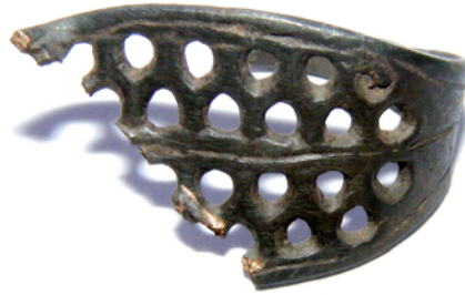
Фрагмент решетчатого перстня, XIII в.

гладких и крученых браслетов коричневого, бирюзового, фиолетового и зеленого цветов, навитая округлая двузонная бусина коричневого цвета) и цветного металла (фрагменты перстней, литого браслета, овальная в плане рамка пряжки). Изделия из кости представлены фрагментом