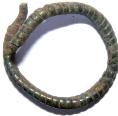
Фрагмент бронзового браслета, XIII–XIV вв.