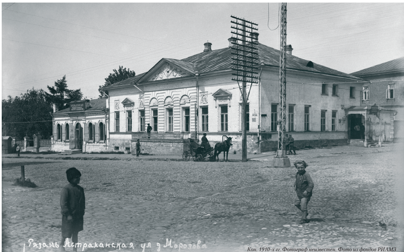
Рязань Астраханская ул у Морозова