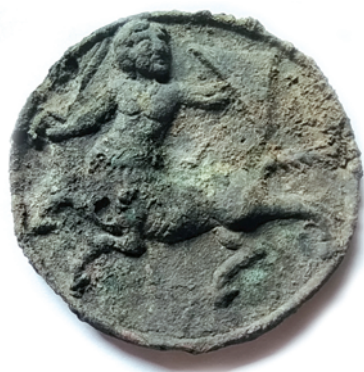
Ил. 1. Матрица с изображением кентавра. Бронза

Остатки построек жилого горизонта – это комплексы двух усадеб, включающих следы жилых сооружений с развалами глинобитных печей, мастерских и хозяйственных построек. Северная усадьба была изучена в 2017–2019 гг., в сезоне 2020 г. исследования велись на территории южной усадьбы.