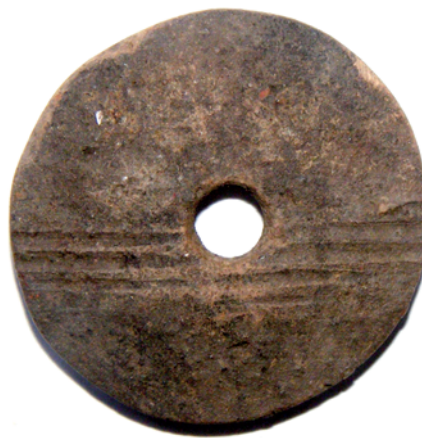
Пряслице, XIV в.