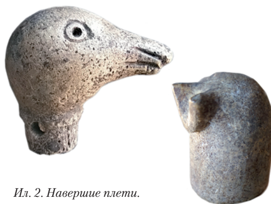
Ил. 2. Навершие плети. Кость

Среди находок матриц особо следует отметить две, происходящие из ямы погребения жилой постройки южной усадьбы. Это, во-первых, крупная матрица для изготовления чечевице-видного колта. На лицевой поверхности матрицы расположен орнамент в виде симметричной пары птиц, обращенных клювами друг к другу и соединенных плетенкой. Вариант этой композиции почти идентичен изображению на колте из клада, найденного в 1887 г. Другая крупная бронзовая матрица представляет собой плоский диск, на лицевой стороне которого