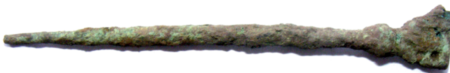
Бронзовое писало, XIII–XIV вв.

накладки, украшенной циркульным орнаментом и прочерченными линиями. Самой яркой находкой сезона можно признать бронзовое писало, обнаруженное в культурном слое между ямами 46 и 50. Это уже третье по счету орудие письма, найденное при раскопках древнего Глебова, что, безусловно, является надежным свидетельством широкого распространения грамотности среди городских слоев населения.