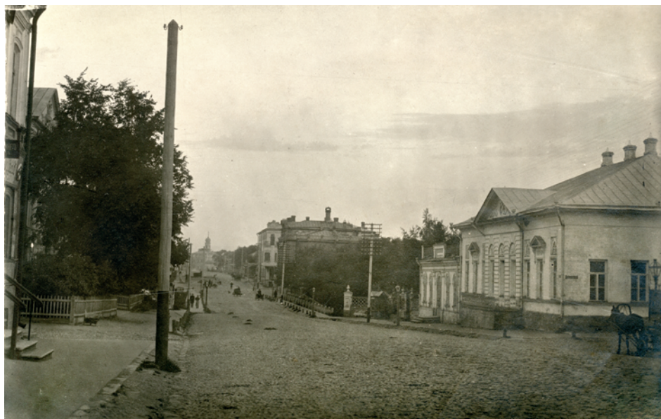
1910-е гг. Перспектива ул. Астраханской (ныне ул. Ленина). Вид на Большой каменный мост, справа дом Морозовых.

На рубеже 1920–1930-х гг. в здании разместился Дом Оборона. Основными направлениями его деятельности были начальная военная подготовка граждан, обучение стрелковому делу, дополнительная подготовка квалифицированных кадров для Красной армии и флота, обуче-