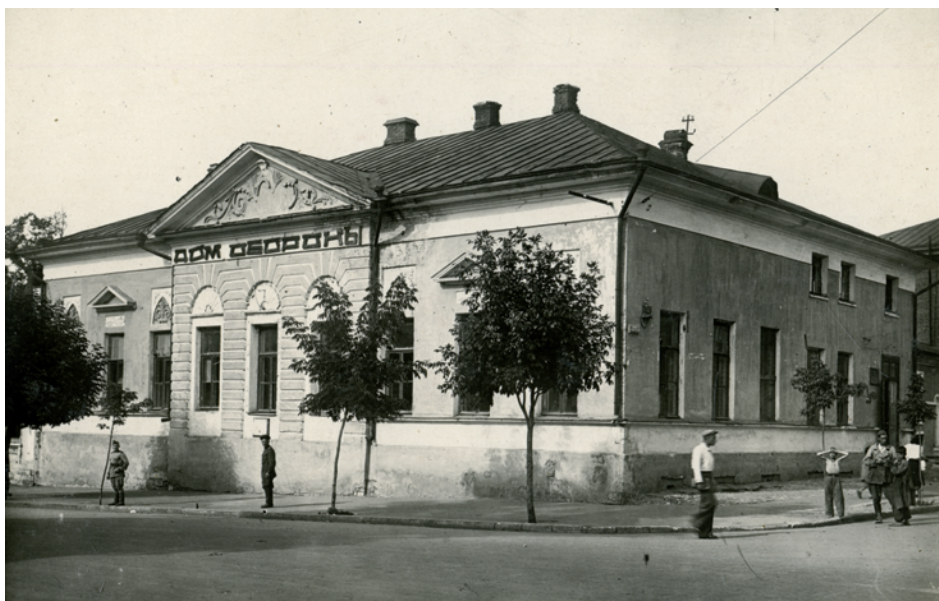
1945 г. Дом Обороны на углу ул. Ленина и Свердлова (ныне ул. Николодворянская).