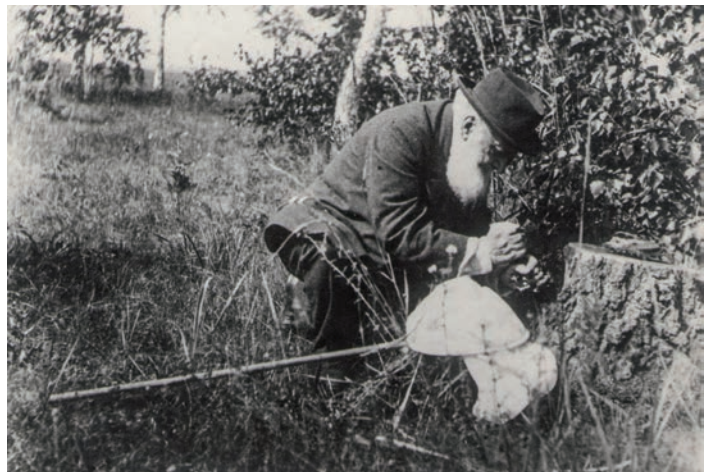
П. П. Семёнов за сбором жуков. 1899 г.