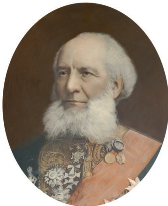
Н.В. Филиппов. Портрет П.П. Семёнова-Тян-Шанского. Из коллекции РИИМЗ

В 1873 г. П. П. Семёнов избирается вице-председателем Русского географического общества и остается на этом посту около 40 лет. Он координировал научную деятельность членов РГО и организацию экспедиций, воспитал целую плеяду блестящих исследователей. Русское географическое общество в результате его деятельности завоевало большой авторитет среди аналогичных об-