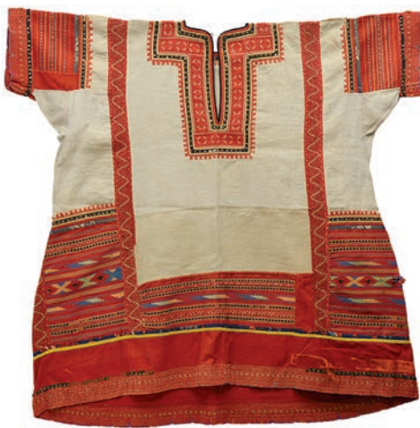
Наверник «наздевик». Начало XX в. Рязанская губерния, Касимовский уезд, Дмитриевская волость, д. Выкуша. Сбор Н. И. Лебедевой, 1922 г.