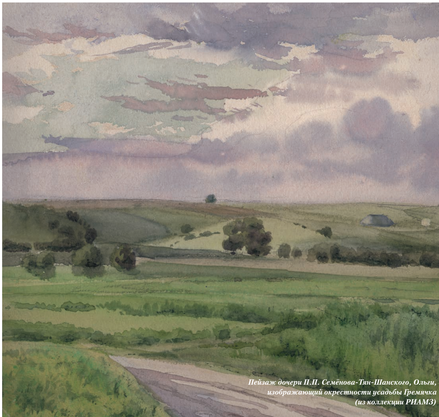
Пейзаж дочери П.П. Семёнова-Тян-Шанского, Ольги, изображающий окрестности усадьбы Гремячка