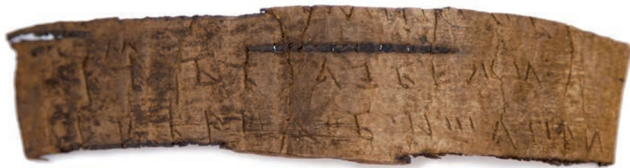
Берестяная грамота, найденная на раскопе в Рязанском кремле 14 августа 2021 г.

Первая берестяная грамота Переяславля Рязанского (современная Рязань) происходит из слоёв второй половины XV в. с территории одной из усадеб в западной части Введенского раскопа, расположенного