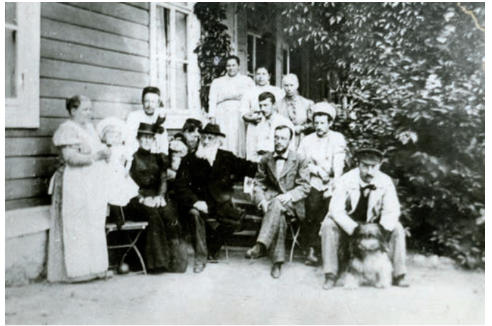
П. П. Семёнов на ступеньках бокового входа в дом в Гремячке среди родных и друзей. 1898 г.

На территории Гремячки находились старый (фруктовый) и молодой сады, парк, гумно, огород. В комплекс построек входили барский дом, два флигеля, многочисленные хозяйственные помещения. После смерти Петра Петровича в 1914 г. имение переходит во владение его сыновьям, но революционный хаос 1917–1918 гг. приводит к тому, что одна из лучших усадеб юга Рязанщины была почти полностью разрушена. До наших дней сохранился лишь кирпичный флигель, возведённый в 1870-е гг., который называли «белым флигелем». К 150-летию со дня рождения П. П. Семёнова-Тян-Шанского в нём была размещена экспозиция, посвящённая жизни и деятельности учёного, основой которой стали мемориальные предметы, переданные в дар внучкой Тян-Шанского Верой Дмитриевной.