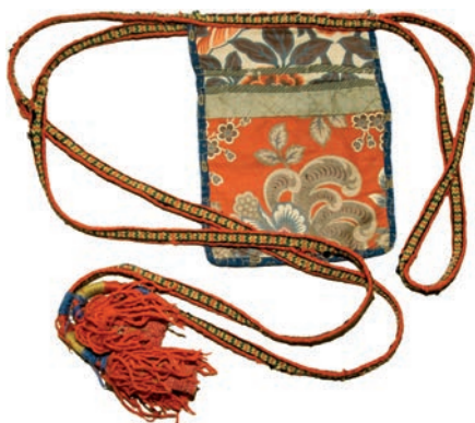
Пояс-лакомка с карманом. Рязанская губерния, Касимовский уезд, с. Б. Мутор. Сбор М. Д. Малининой, 1927 г.

и подробными описаниями. В результате интенсивной экспедиционной деятельности фонды музея пополнились этнографическими предметами, зарисовками, фотографиями, появился богатый научный архив. Формировались коллекции женской одежды,