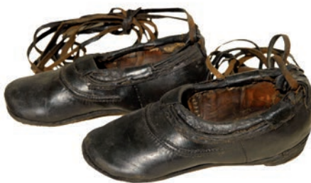
Праздничная обувь «коты». XIX в. Рязанская губерния, Сапожковский уезд, Пригородная волость, пригородная слобода г. Сапожка. Сбор Н. И. Лебедевой, 1923 г.

художественной вышивки, кружев, тщательно подобранные и научно обработанные.