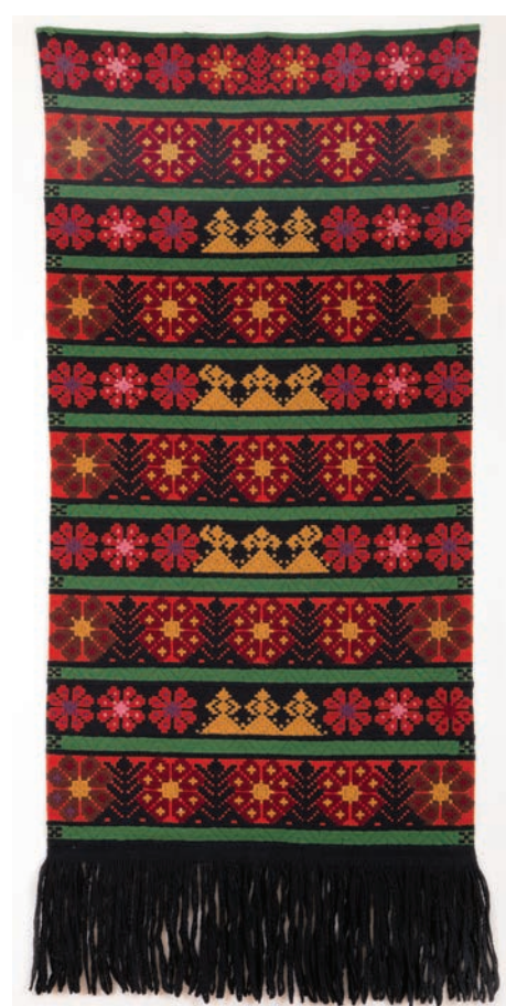
В.В. Грумова. Панно из комплекта «Земля моя». 1980 г.

В числе экспонатов выставки – новые поступления в коллекцию музея-заповедника. Это работы рязанских мастериц, посвятивших