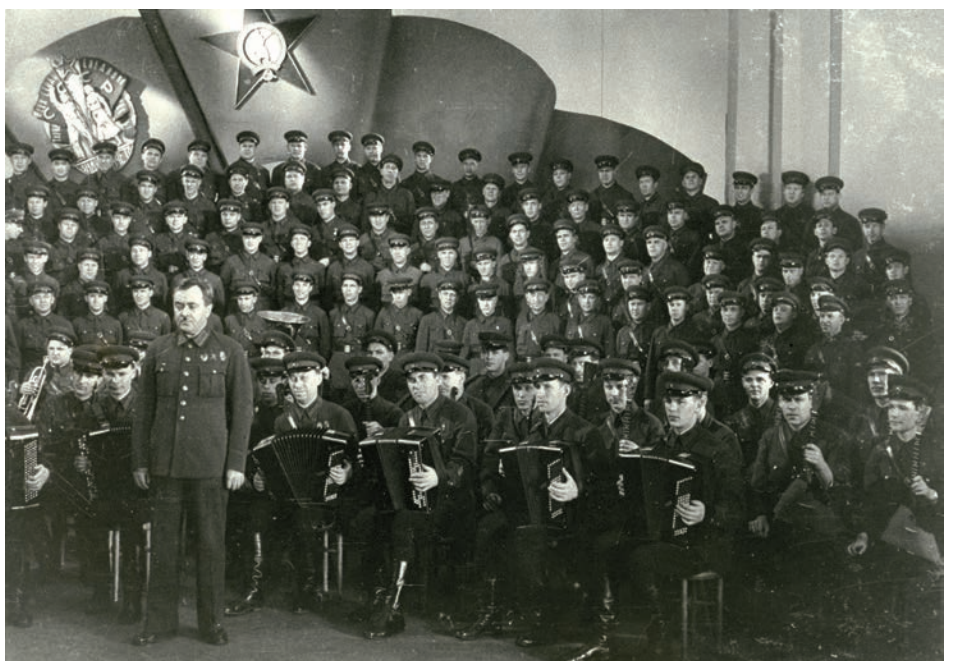
А.В. Александров во время первого исполнения Государственного Гимна СССР по радио Краснознаменным ансамблем песни и пляски Советской Армии под его руководством. 1938 г.