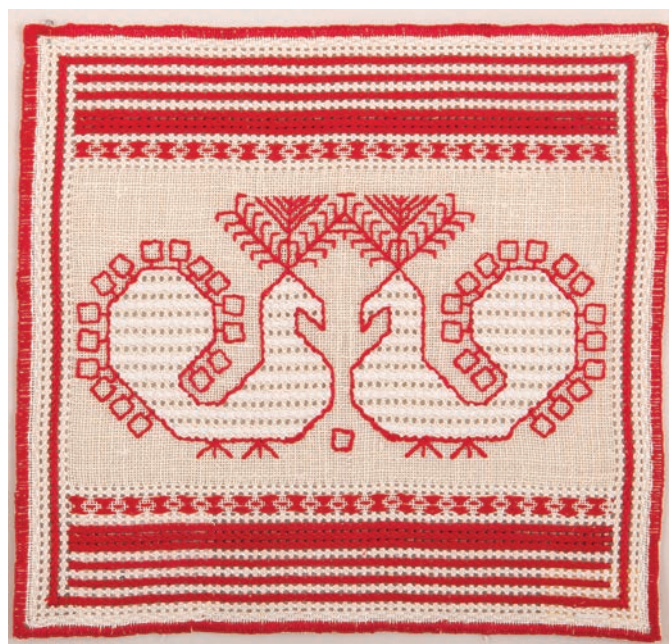
З.А. Зайцева. Салфетка. Конец 1970 гг.