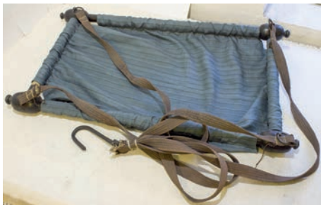
Люлька бишек. Начало XX в. Коллекция РИАМЗ.

Специально оборудованных детских комнат не было, все члены семьи размещались в одном помещении – «спаленке». В некоторых семьях у де-