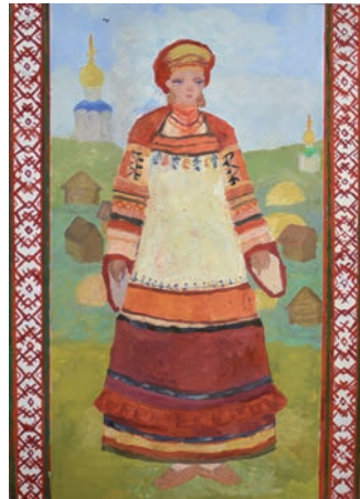
Тихонова Софья, 13 лет. «Рязанская губерния»