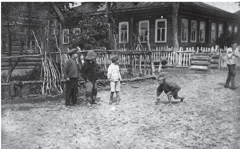
Татарские дети за игрой в казанки, д. Сеитово Касимовского уезда Рязанской губернии. 1925 г. Коллекция РИАМЗ

Воспитывали детей в строгости и послушании. Наиважнейший постулат – это уважение и почтение к взрослым. Родители относились к проблемам детей со вниманием, не унижали и не били. Озорных ребят припугивали Аю-Бабаем (дедушка-медведь), Шурале (дух леса), Шайтаном (черт). Наказанием за ослушание служили разъяснительные беседы,