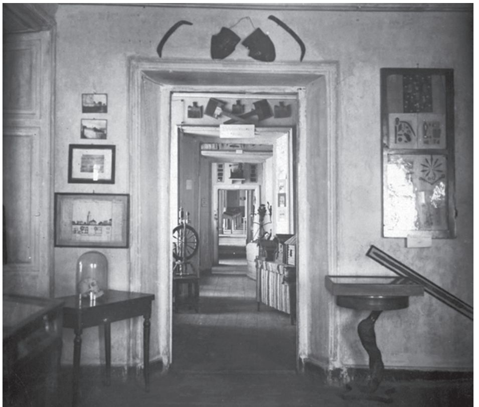
Экспозиция во Дворце Олега. 1924 г.

Жизнь музея стала сложнее. Ран- ше он был, так сказать, членом семьи Губоно: жил в его помещении, пользо- вался его отоплением, его освещением, а теперь он превратился в хозяина: у него трехэтажный большой дом, два двухэтажных флигеля (Конси- сторский и Певческий корпуса. – Ред.), каретные сараи, конюшни, кладовые, бывшая усадьба с садом, даже двумя