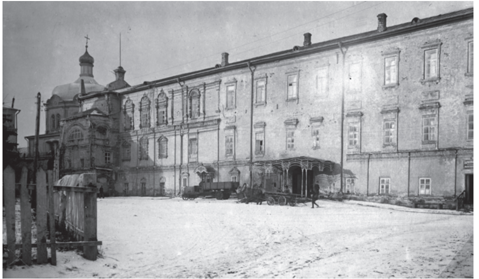
Переезд музея во Дворец Олега. 1923 г.

7 октября 1923 г. очень торже- ственно было отпраздновано откры- тие музея в новом помещении, а затем потекла обычная жизнь, но в новом по- мещении и в иных условиях, чем прежде.