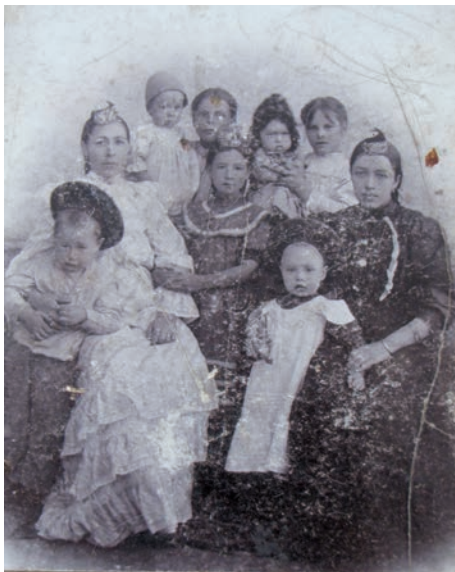
Фото из семьи Тузеевых. Нач. XX в. Экспедиция РИАМЗ 2011 г.

тей был духовный родитель женского пола – «чача анасэ», обычно одна из родственниц или подруг. Те же функции выполняла «тыш-татэ» – зубная тетка. Активное участие в воспитании принимали бабушка «эбей» и дедушка «бабай». Они приучали к народным традициям и обычаям, обучали татарскому языку, рассказывали сказки, читали молитвы.