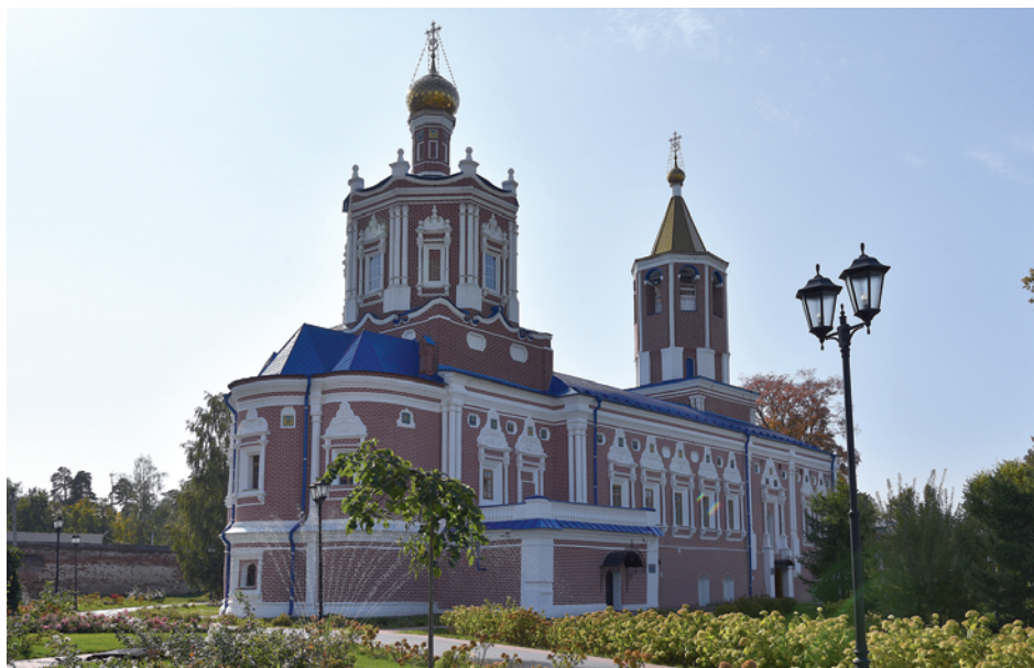
Церковь Святого Духа. Автор фото Н.В. Водорезова. 2020 г. РИАМЗ

Наталья Александровна Штефанок, старший научный сотрудник отдела истории РИАМЗ