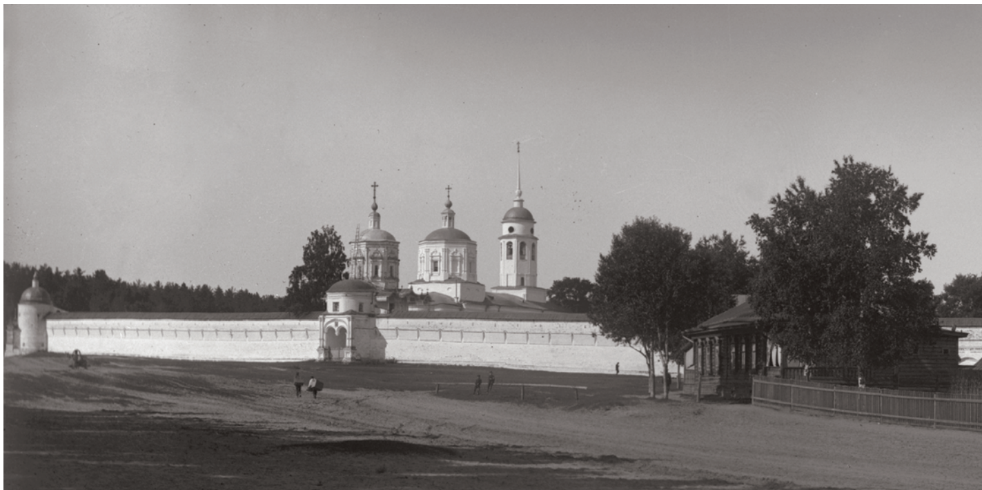
Вид на Солотчинский монастырь. 1913 г.