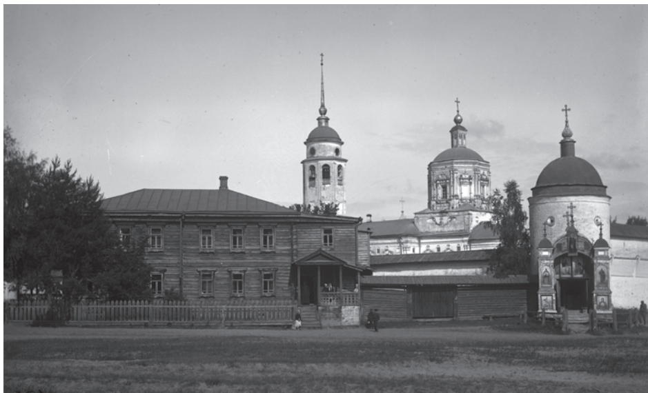
Солотчинский монастырь и гостиница для приезжающих богомольцев. 1913 г.

В 1917 г. службы были остановлены, монастырь закрыт. Благодаря активно развернувшемуся краеведческому движению, а также деятельности историков и музейных работников удалось сохранить часть монастырской утвари, представлявшей культурную и историческую ценность. В 1920 г. мощи Великого князя Олега Ивановича были переданы в Рязанский губернский музей, а на территории монастыря располагалась колония для детей-сирот. В 1924 г. в Солотче организовали комплекс оздоровительных лагерей и санаторных организаций. В 1940-е гг. здесь находились административные учреждения. В 1950-е гг. в отдельных корпусах располагалась гостиница для приезжающих. В 1968 г. архитектурный