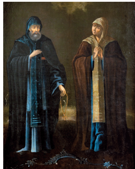
Портрет основателя Солотчинского монастыря Великого князя Олега Ивановича Рязанского и его супруги Великой княгини Ефросинии. Экспозиция РИАМЗ «От Руси к России»

Церковь Иоанна Предтечи над Святыми воротами строилась одновременно с восточной монастырской стеной в 1690-е гг. Надвратная церковь построена в стиле московского барокко. Кирпичный карниз, белокаменная отделка дополняются крупными полихромными вставками с рельефными изображениями четырех евангелистов. Ценинные барельефы,