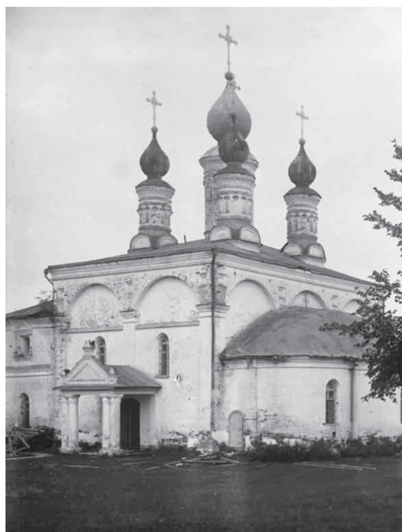
Храм Рождества Богородицы. 1929 г.