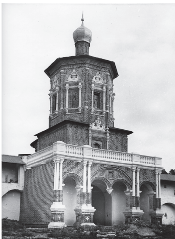
Надвратная церковь в честь Иоанна Предтечи. Фото конца 1980-х – начала 1990-х гг. из коллекции РИАМЗ

Каменные братские кельи и Настоятельский корпус были построены в XVIII в. Тогда же была достроена каменная ограда монастыря с северной