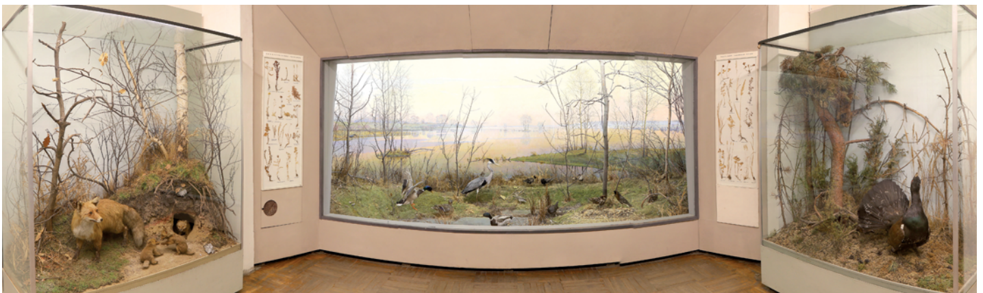
▼ Экспозиция «Человек и природа», зал «Весна»