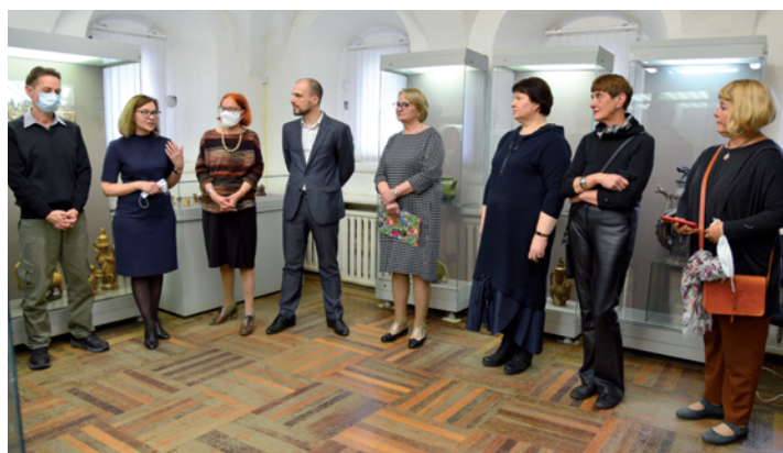
Торжественное открытие выставки 13 октября 2020 г.