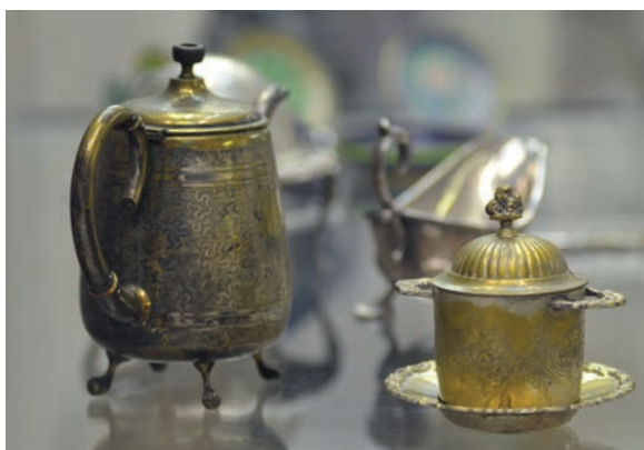
Кофейник, соусник с подставкой. Конец XIX в. Металл