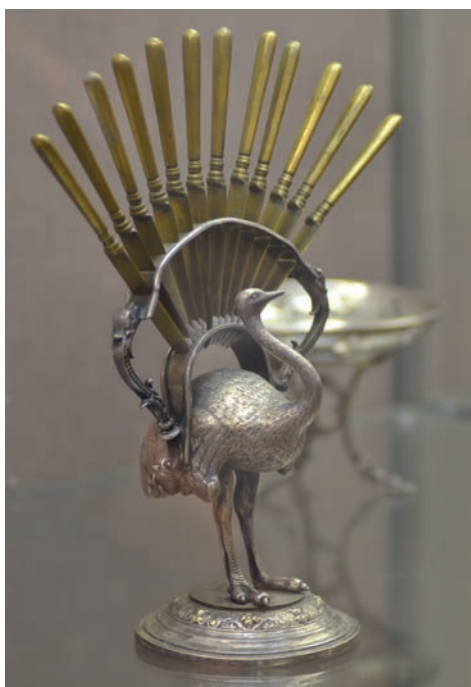
Подставка с 12-ю ножками. Начало XX в. Латунь

Металл – один из наиболее древних материалов, который человечество открыло и начало широко использовать. Особым явлением в культуре и искусстве стала его художественная обработка. Россия издавна славилась этим мастерством, достигшим высокого уровня развития еще во времена Киевской Руси. Искусство работы по металлу вновь расцветает в XIV–XVII вв. Фактором, сдерживающим его развитие, была нехватка сырья, так как драгоценные (золото, серебро) и цветные (медь, олово) металлы ввозились из-за рубежа. Начало XVIII в. – знаменательная веха в истории русского художественного металла, связанная с преобразованиями Петра I. Открытие богатейших рудных месторождений на Урале и создание на их базе мощной горнорудной промышленности обеспечило страну чёрным и цветным металлом и дало передовые для своего времени технологии. Появились декоративные металлические изделия из чугуна, латуни, меди, бронзы. В бытовой жизни русского человека начали использоваться ранее незнакомые предметы: самовары, чайники, кофейники, супницы, табакерки. Дворяне стали носить костюм на за-