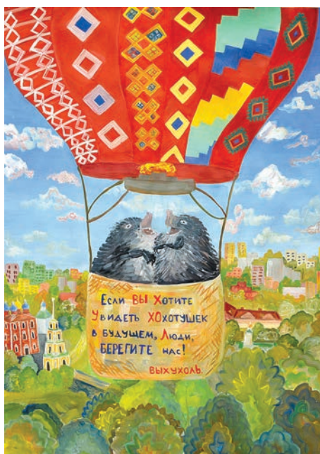
Шаньгина Елизавета, 13 лет

Для привлечения внимания к проблеме сохранения на нашей планете этого уникального зверя музей-заповедник провёл творческий конкурс «Знакомьтесь, выхухоль!» Желающим принять участие в конкурсе предлагалось представить свой