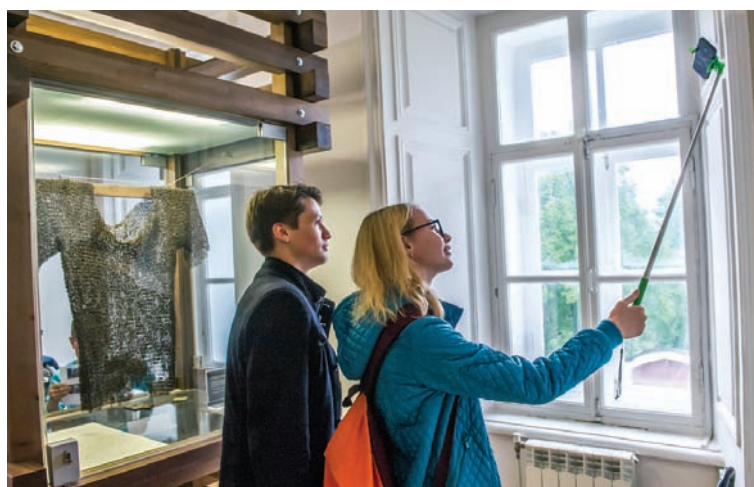
Селфи на фоне экспоната – обязательное условие для прохождения музейного квеста (2016 г.)