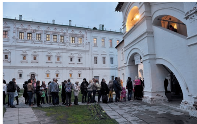
Очередь в экспозицию «По обычаю дедову» (2015 г.)