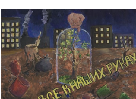
Калинина Евгения «Все в наших руках»