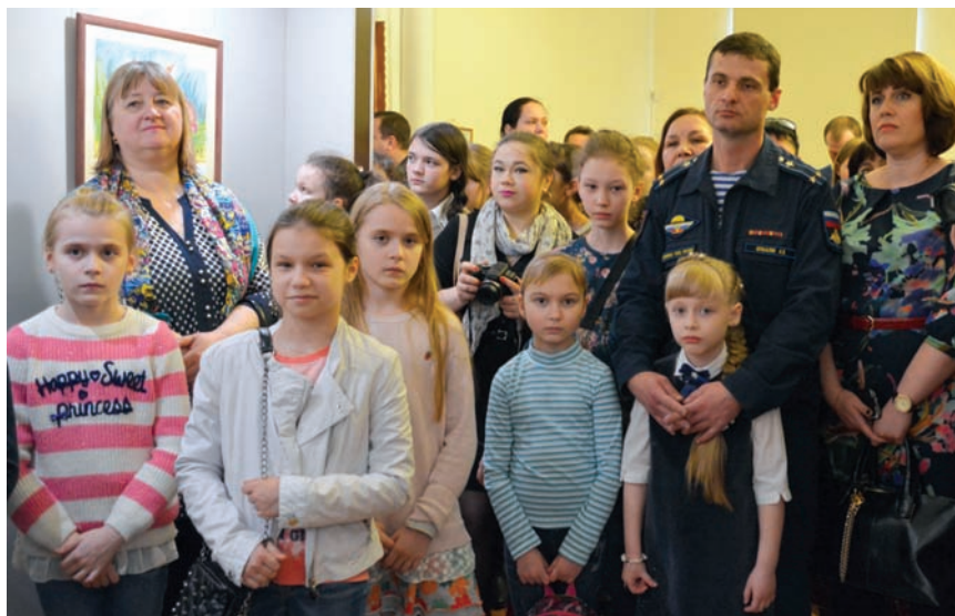
Юные художники – участники конкурса – на открытии выставки 22 апреля 2017 г.

Ребята постарались создать яркие, эмоциональные, запоминающи-