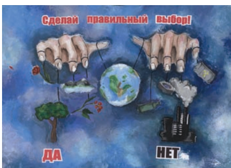
Митюшина Олеся «Сделай правильный выбор»