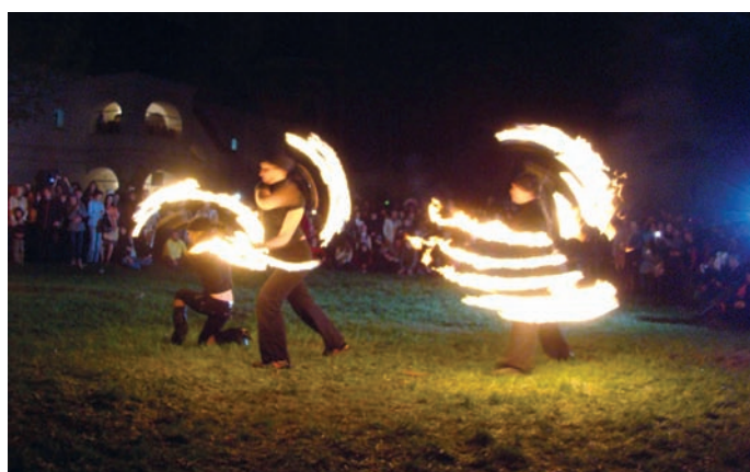
Fire show (2009 г.)