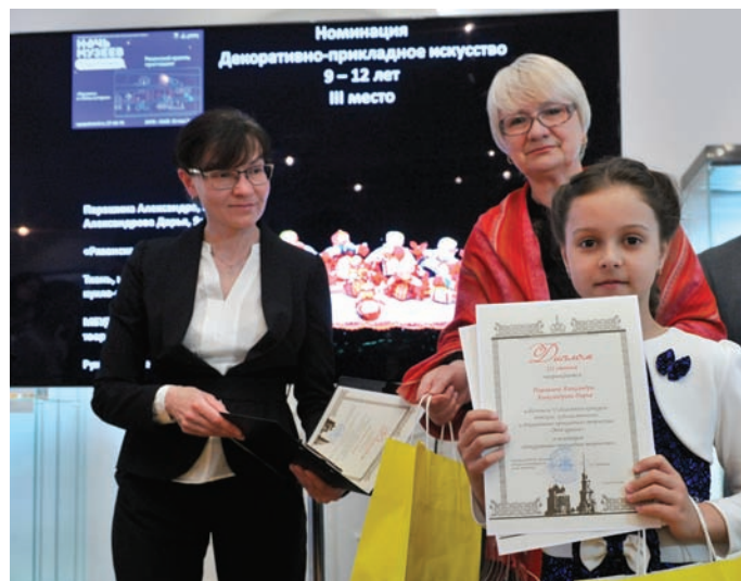
Награждение победителей V Областного конкурса детского художественного творчества «Мой кремль» (2016 г.)