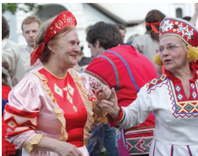
«Лет десяток с плеч долой, в омут танца с головой!» (2013 г.)