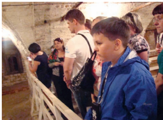
Экскурсия в подклете Успенского собора (2012 г.)