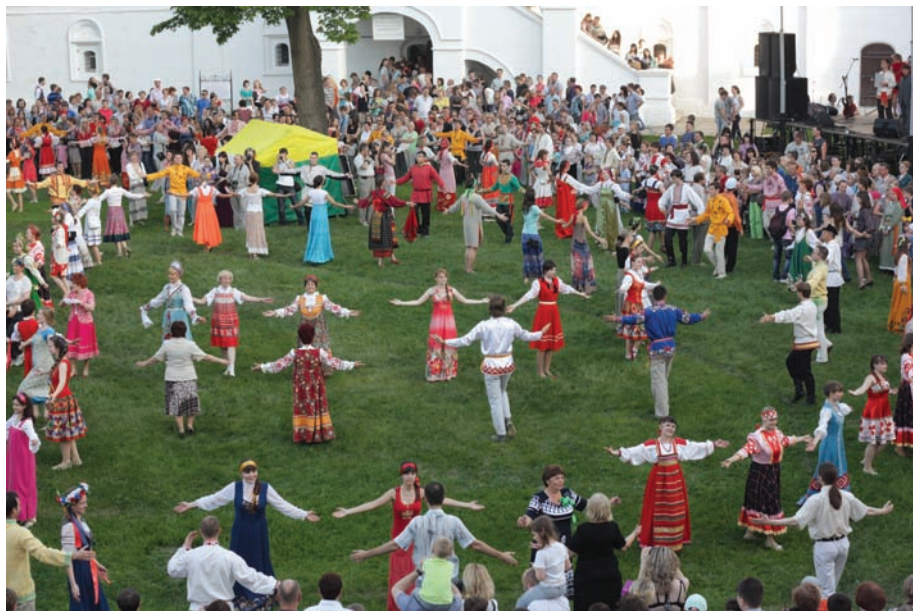
«Народный пляс» от Школы танцев Губернского бала превратил Двор Олега в танцевальную площадку (2012 г.)