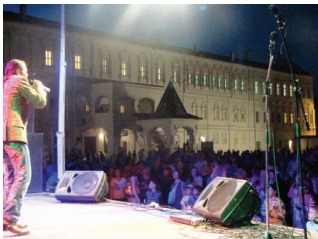
Концерт на сцене под открытым небом (2012 г.)