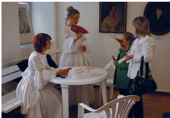
Азы «языка веера» от галантных дам (2009 г.)