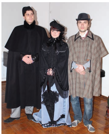
Посетители исторического фотоателье (2011 г.)