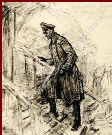
Работа из серии «Военнопленные»

Выставка «Сталинград 1942–1943 гг. глазами художников», которая откроется в музее-заповеднике накануне Дня Победы, предоставлена Государственным историко-мемориальным музеем-заповедником «Сталинградская битва».