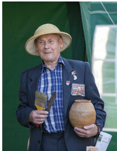
Участник археологической «Ночи музеев-2014»