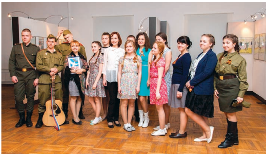
Студенты и курсанты Академии ФСИН РФ после концерта к 70-летию Победы (2015 г.)